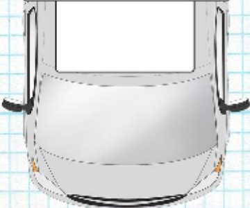
Esquema vista superior